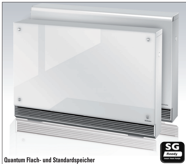
Quantum Flach- und Standardspeicher