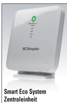
Smart Eco System Zentraleinheit

QUANTUM est un accumulateur dynamique intelligent qui emmagasine la chaleur lorsque les coûts d'électricité sont le plus bas puis en libérant ultérieurement cette chaleur dans les pièces au besoin.